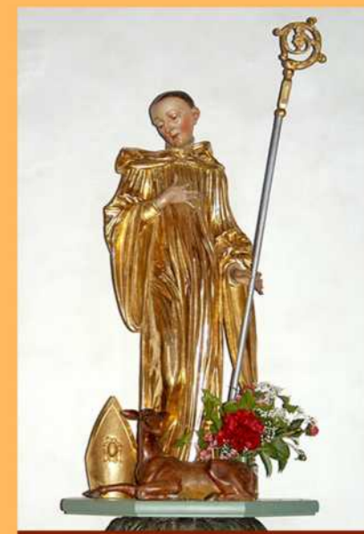
1 Hl. Ägidius

Unsere Heiligen, diese stillen Zeitzeugen und Wegweiser, begleiten uns auf dem Weg zu Gott, dem Ursprung allen Lebens.